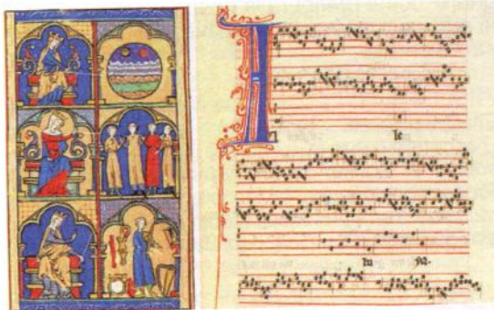
Miniatura dal codice "Magnus Liber Organi" (Grande libro dell'Organum), raccolta di composizioni medievali, pubblicata tra il XII e il XIII sec. Viene attribuita ai maestri che operavano nella Scuola di Notre-Dame. A destra: a uno di questi maestri, Perotin, è attribuito l'Alleluia nativitas , qui riprodotto in una pagina del "Codex Guelf. 1099" (XIII sec.).

La partecipazione del popolo al canto, già venuta meno nei secoli precedenti, era ora discriminata anche a livello culturale essendo i nuovi stili di canto non confacenti alla sensibilità del popolo, ormai costretta a forgiarsi sulla musica profana per esprimere il sentimento religioso. L'intervento deciso del Magistero cercò di arginare le esagerazioni stilistiche, in primo luogo attraverso il rifiuto di ciò che non era ritenuto degno per la liturgia (come l'uso della voce). Nonostante ciò, la preghiera con il canto restava compromessa e richiedeva venti di rinnovamento o di restaurazione. M o Sergio Militello